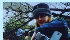
Stiúrthóir: Audrey O'Reilly