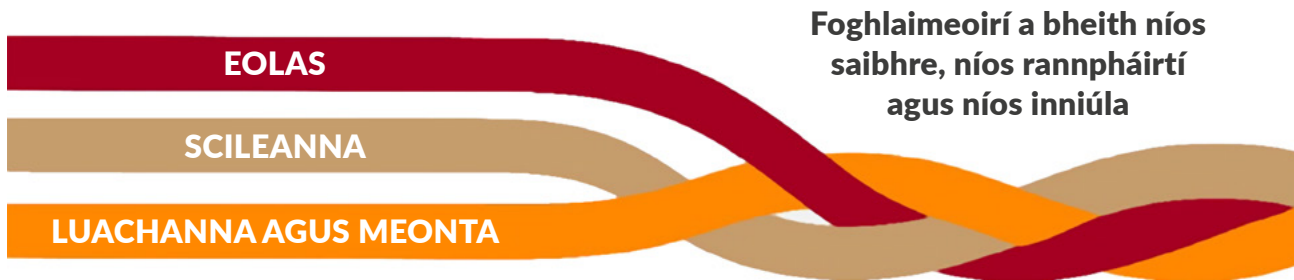
Fíor 1: Comhpháirteanna na bpríomhinniúlachtaí agus an tionchar a mianaítear leo

Is scáth-théarma é Príomhinniúlachtaí ina ndéantar tagairt don eolas, na scileanna, na luachanna agus na meonta a fhorbraíonn an scoláire ar bhealach imeasctha le linn na sraithe sinsearaí.