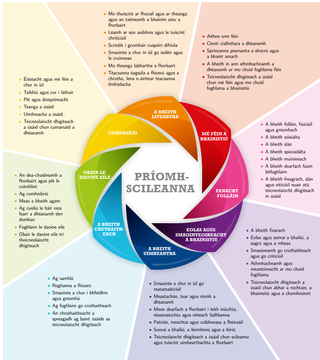
Fíor 1: Príomhscileanna na sraithe sóisearaí

Sa bhreis ar eolas sainsiúil cothaíonn ábhair agus gearrchúrsaí na sraithe sóisearaí deiseanna chun raon príomhscileanna a fhorbairt. Tá féidearthachtaí ann tacú leis na príomhscileanna go léir le linn an chúrsa seo ach tá cuid díobh fíorthábhachtach. Leagtar amach na hocht bpríomhscil go mion i bPríomhscileanna na Sraithe Sóisearaí.