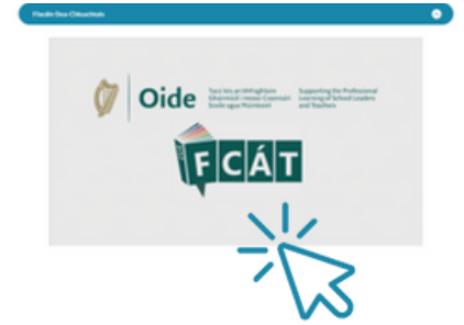
Cliceáil anseo chun físeán de rang Mata leis an gcur chuige FCÁT a fheiceáil.

Tá ardmholadh ag dul do na scoileanna, na múinteoirí, is na páistí a ghlac páirt sa tionscadal.