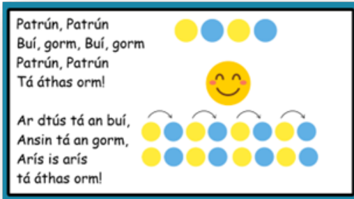
Ag úsáid dánta chun teanga an ábhair a mhúineadh: Sampla ó Aonad Oibre Samplach 4 na Naíonán .