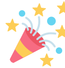
Múinteoirí Iar-bhunscoile FCÁT2024-2025