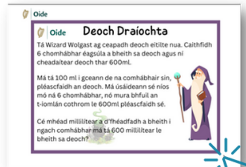
Eiseamláirí Iontacha ó shuíomh PMC Oide.

Cabhraíonn sé sin le múinteoirí gníomhaíochtaí tascbhunaithe le fóirghá le cumarsáid a chur ar fáil do na páistí.