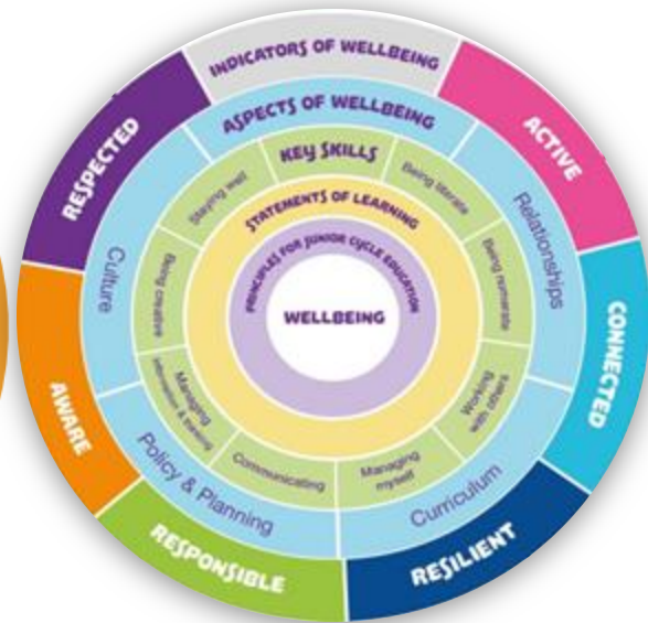
Treoirínte le haghaidh Folláine, (CNCM, 2021)